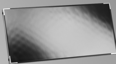
Vitosol 100-F SH1A/SH1B