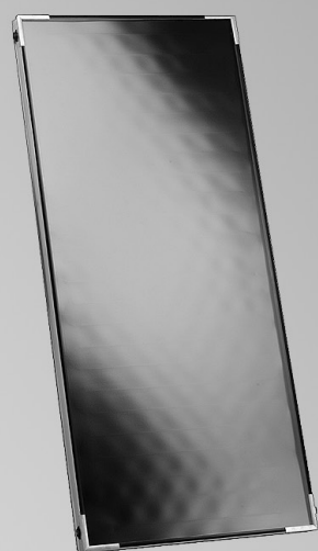
Vitosol 100-F SV1A/SV1B